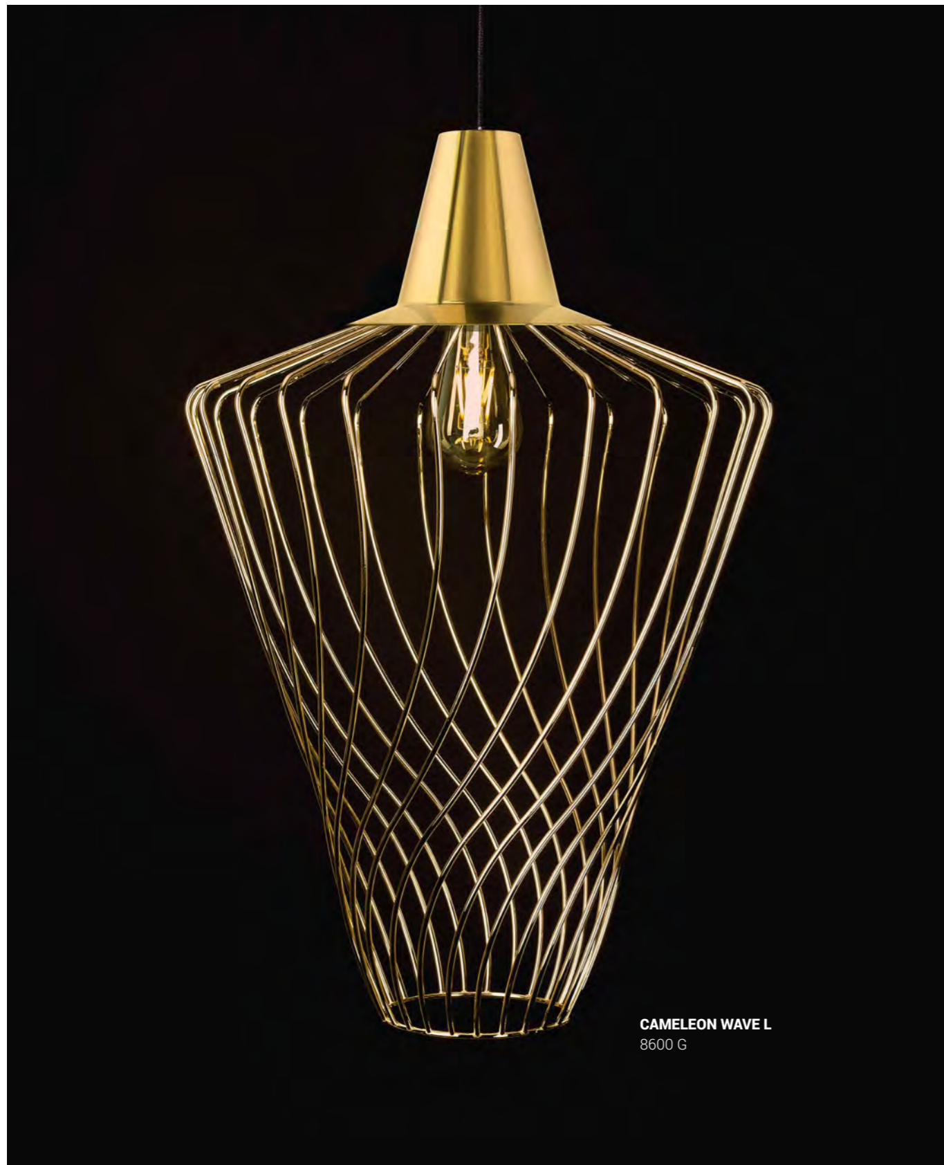
CAMELEON WAVE L 8600 G